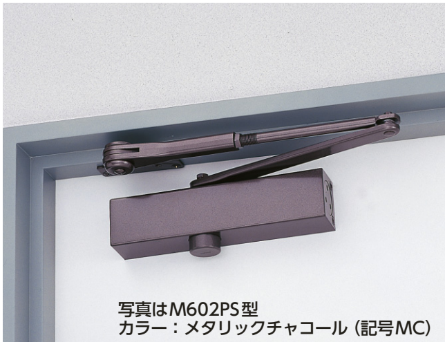
写真はM602PS型 カラー:メタリックチャコール(記号MC)