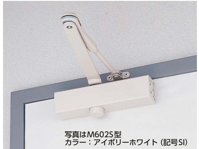
写真はM602S型 カラー:アイボリーホワイト(記号SI)