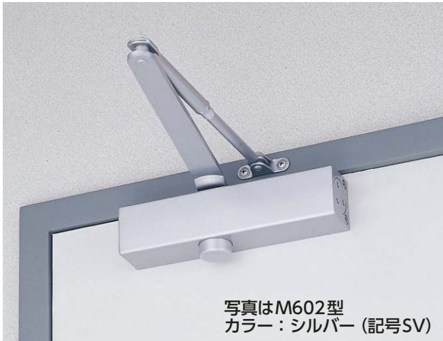
写真はM602型 カラー:シルバー(記号SV)