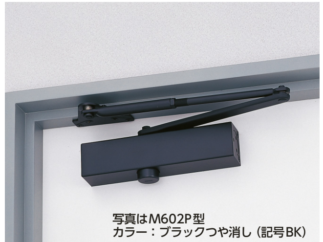
写真はM602P型 カラー:ブラックつや消し(記号BK)