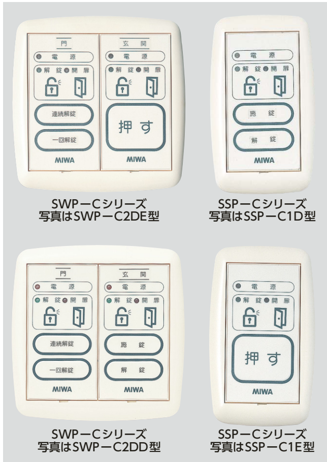
SWP-Cシリーズ 写真はSWP-C2DE型