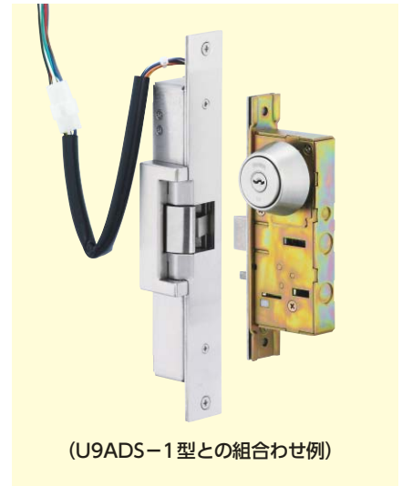
(U9ADS-1型との組み合わせ例)