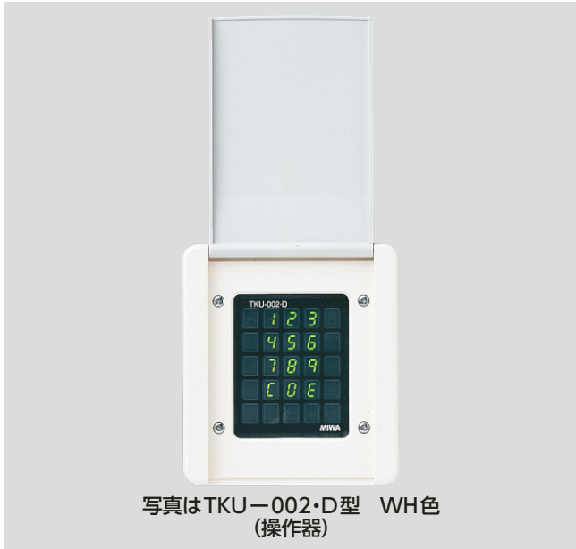
写真はTKU-002・D型 WH色 (操作器)

型 ■用途:住宅/マンション/寮/ビル/病院等 ■納期:標準納期品 ●(P3参照) 制御器は屋内仕様