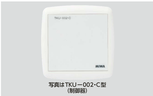
写真はTKU-002・C型 (制御器)